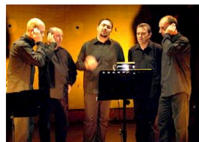
Le groupe MERIDIANU