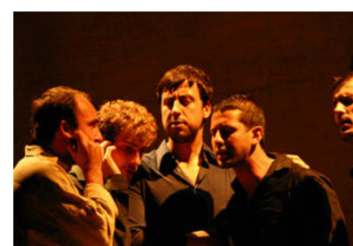
Le groupe ALBA