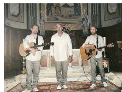
Le groupe ARAPA